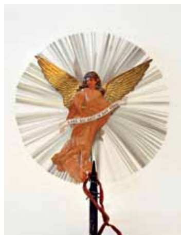
Glasseidenspitze mit Engel; um 1900

Rauschgoldengels vollzog sich etwa zeitgleich im 19. Jahrhundert.