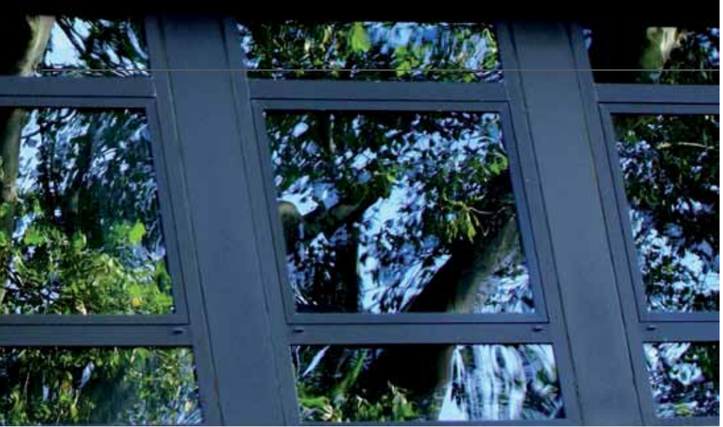
Spiegelung der Platane in den Fenstern der DEG. Die Platane ist eines von zwei Naturdenkmälern der Herrrigergasse.

schutzstellung wurde der von den Bürgern scharf kritisierte VEP Herrrigergasse, der sowohl die nördliche wie auch die südliche Seite der Herrrigergasse betraf, zurückgezogen.