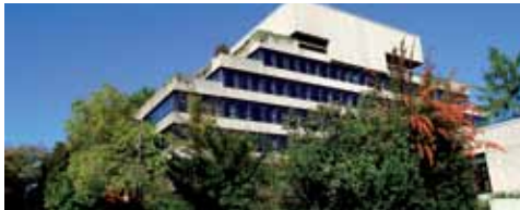
Seite 6 - Schutz der Terrassenkante