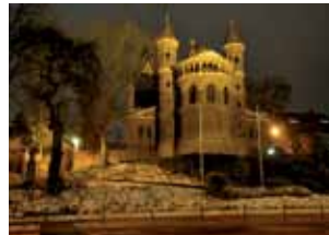
Seite 37 - Kurznach- richten: St. Vitalis in neuer, prachtvoller Beleuchtung