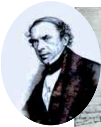
Ludolf Camphausen, treibende Kraft