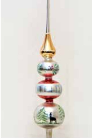
Stufenspitze in Pickelhaubenform handgemalt; um 1950

verschiedensten christlichen oder weltlichen Motive, die aus harter Pappe in die jeweilige Form „hohlgepresst“ waren. Dieser Baumschmuck konnte reich vergoldet oder versilbert oder auch farbig angemalt sein. Teilweise waren diese Weihnachtbaumspitzen nur auf einer Seite geprägt. Es finden sich aber viele Belegstücke, bei denen zwei geprägte Teile seitengleich aufeinander geklebt sind. Nach und nach wurden auch andere Motive verwendet, wie zum Beispiel Engel, Sterne, Kutschen, später sogar – nach 1870/71 – Kriegsmotive.