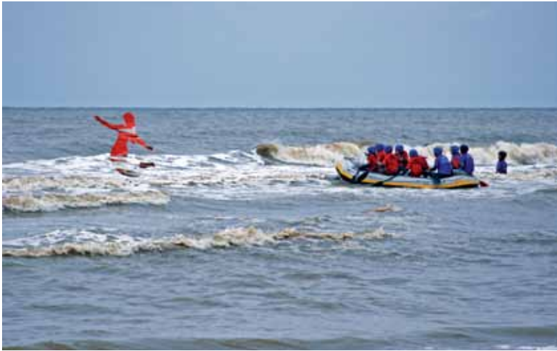
Odysseus, Fotomontage Foto auf Alu-Bond