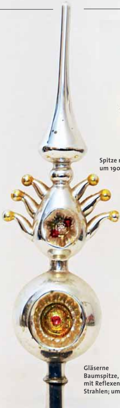
Gläserne Baumspitze, auch mit Reflexen und Strahlen; um 1930