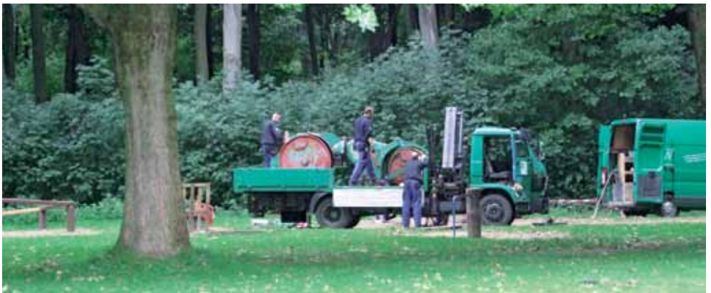
Entsorgung eines Kindertraums am Spielplatz Kämpchensweg

Laut Auskunft der Stadt soll die Dampfwalze nicht mehr den üblichen Anforderungen an die Sicherheit solcher Spielgeräte genügt haben. Es soll ein Fachgutachten vom TÜV erstellt worden sein. Dieses Gutachten wird den Bürgern bisher vorenthalten. Der Bürgerverein bittet darum, ihm dieses Gutachten in Kopie zuzuleiten, damit wir uns wenigsten im Nachhinein davon überzeugen können, dass die notwendigen Anforderungen an die Verkehrssicherheit bei der Dampfwalze tatsächlich nicht mehr erfüllt waren. Das Gutachten wird aller-