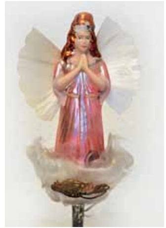
Engel mit gesponnener Glas- seide und Glaswolke; um 1950