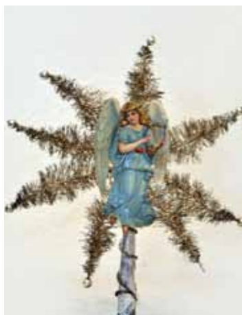
Lamettabürstenspitze mit Engel; um 1900