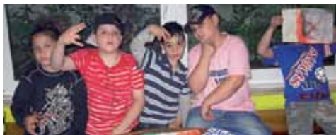
Seite 30 - Kinderarbeit in der OT