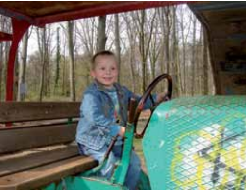
Glückliche Kinder - das war einmal.

dings unabhängig davon nicht als Rechtfertigung dafür herhalten können, wie die Stadt Köln hier mit den Bürgern umgegangen ist.