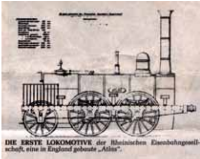
Die erste Lokomotive der Rheinischen Eisenbahngesellschaft

Grenze bei Herbesthal. Dafür konzessioniert Preußen 1837 die Rheinische Eisenbahngesellschaft in Köln. Schnell werden jetzt drei Millionen Taler berechnetes Aktienkapital gezeichnet.