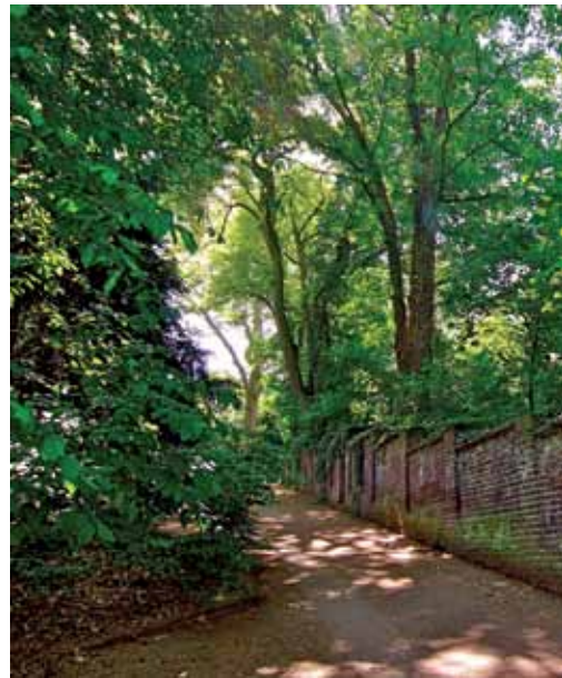
Schützenswerter alter Baumbestand entlang historischer Ziegelmauer

Auf diesen positiven Erfahrungen aufbauend, hoffen wir weiterhin auf die Unterstützung durch die Politik, wenn es um die Neugestaltung bzw. Neubebauung des ehemaligen DEG-Geländes geht. Da der Bebauungsplan Herrigergasse infolge der Ratsentscheidung zur Unterschutzstellung der Terrassenkante zurückgezogen wurde, kommt es jetzt darauf an, dass die bauliche