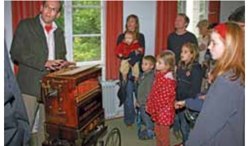
Historische Instrumente fesseln die Kleinsten.

musikalische Akzente und erklärten den begeisterten Gästen die technischen Details der Instrumente.