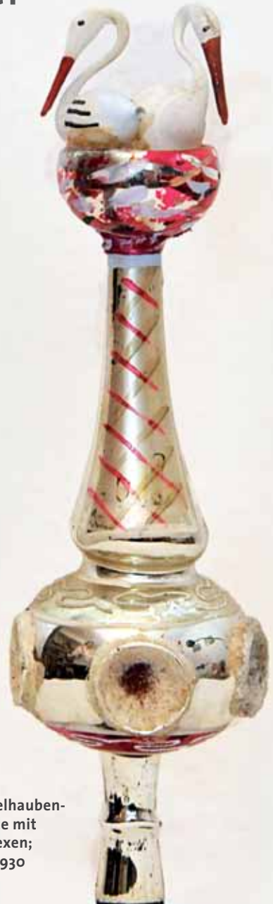
Pickelhauben- spitze mit Reflexen; um 1930