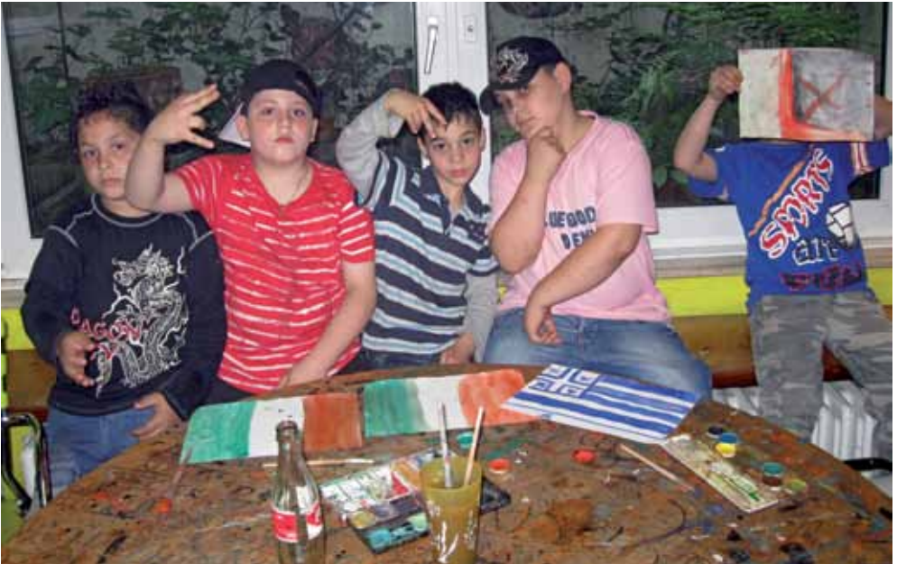
Flaggen malen: ein bunter Freizeitspaß für die jüngsten Besucher

Die Kinder unserer Umgebung haben an jedem Öffnungstag die Möglichkeit, die Einrichtung bis 21:30 Uhr zu besuchen.