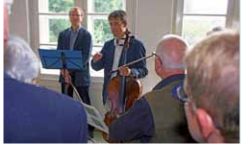
Große Musik aus der Zeit der Romantik