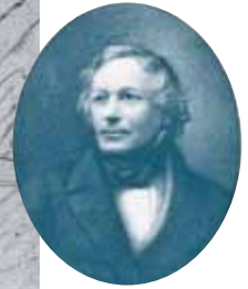
David Hansemann holt die Bahn nach Aachen