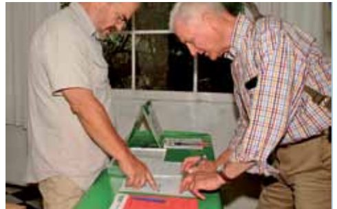
Unterschriften zur Mitarbeit im Arbeitskreis