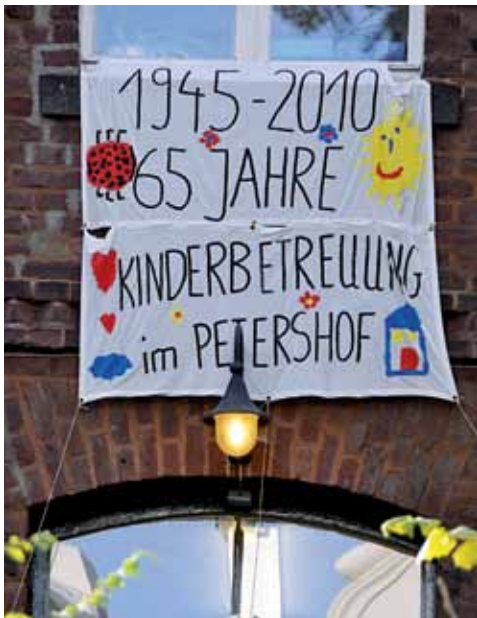
Jubiläumsfeier im historischen Ambiente des Peterhofes im Juni 2010

Integration – Kinderarbeit im Jugendzentrum Stolberger Straße