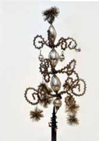
Spitze mit Leonischen Drähten; um 1900