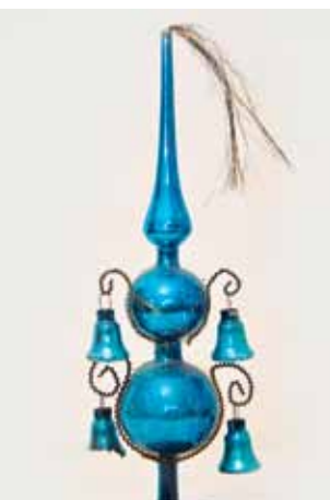
Pickelhaubenspitze mit Glöckchen; ab 1900