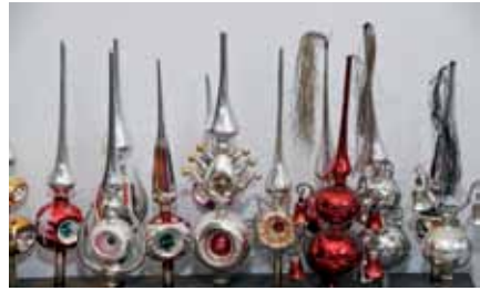
Seite 32 – Sammlung alter Christbaumspitzen