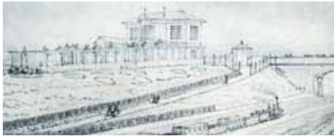
Seite 16 - Der Eiserne Rhein