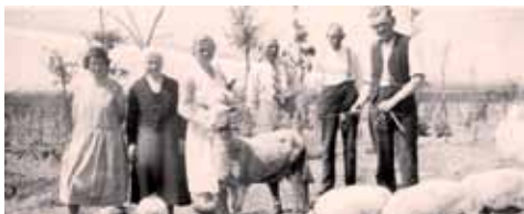
Seite 18 - Zeitzeugen des Bahnhofs Belvedere